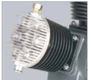
Kühler Kopf Aluminium-Zylinderköpfe mit hervorragender Wärmeabführung für längere Lebensdauer.