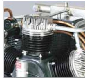
Hochwirksame Kühlung Aluminium-Zylinderköpfe mit hervorragender Wärmeabführung für längere Lebensdauer.