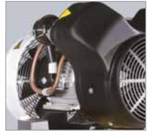
Doppelte Kühlung Hochwirksame Kühlung mit zweifachem Luftstrom; Innenkühlung des Kurbelgehäuses erlaubt Maximaldruck bis zu 10 bar (KCT 401 bis 840).