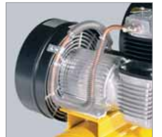
Direktantrieb Direktgekuppelte Aggregate bauen kompakter. Sie sind wartungsfrei und arbeiten ohne Übertragungsverluste.