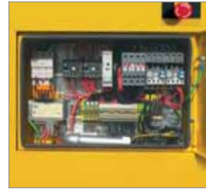
Schaltschrank komplett verdrahtet, Bedientafel mit Betriebsstundenzähler und Betriebsarten-Wahlschalter.