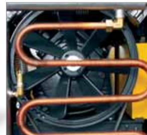
Gute Kühlung mit Druckluft-Nachkühlrohr aus Kupfer.