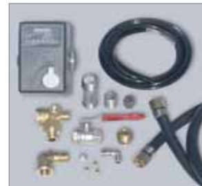
Zubehör Speziell angepasstes Set von Steuer- und Verbindungsteilen für den einfachen Anschluss.